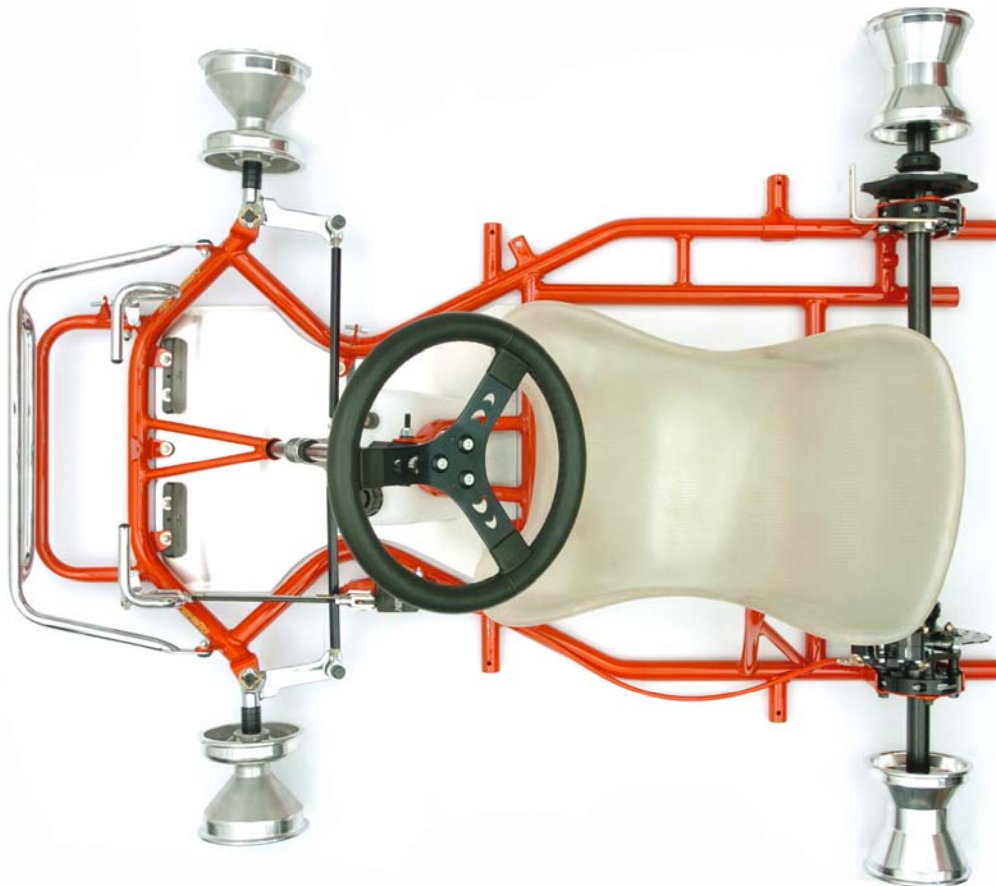
FOTO DEL TELAIO COMPLETO IDENTICO AD UNO DEI MODELLI PRESENTATI ALL'ISPEZIONE, SENZA CARROZZERIE E SENZA PNEUMATICI